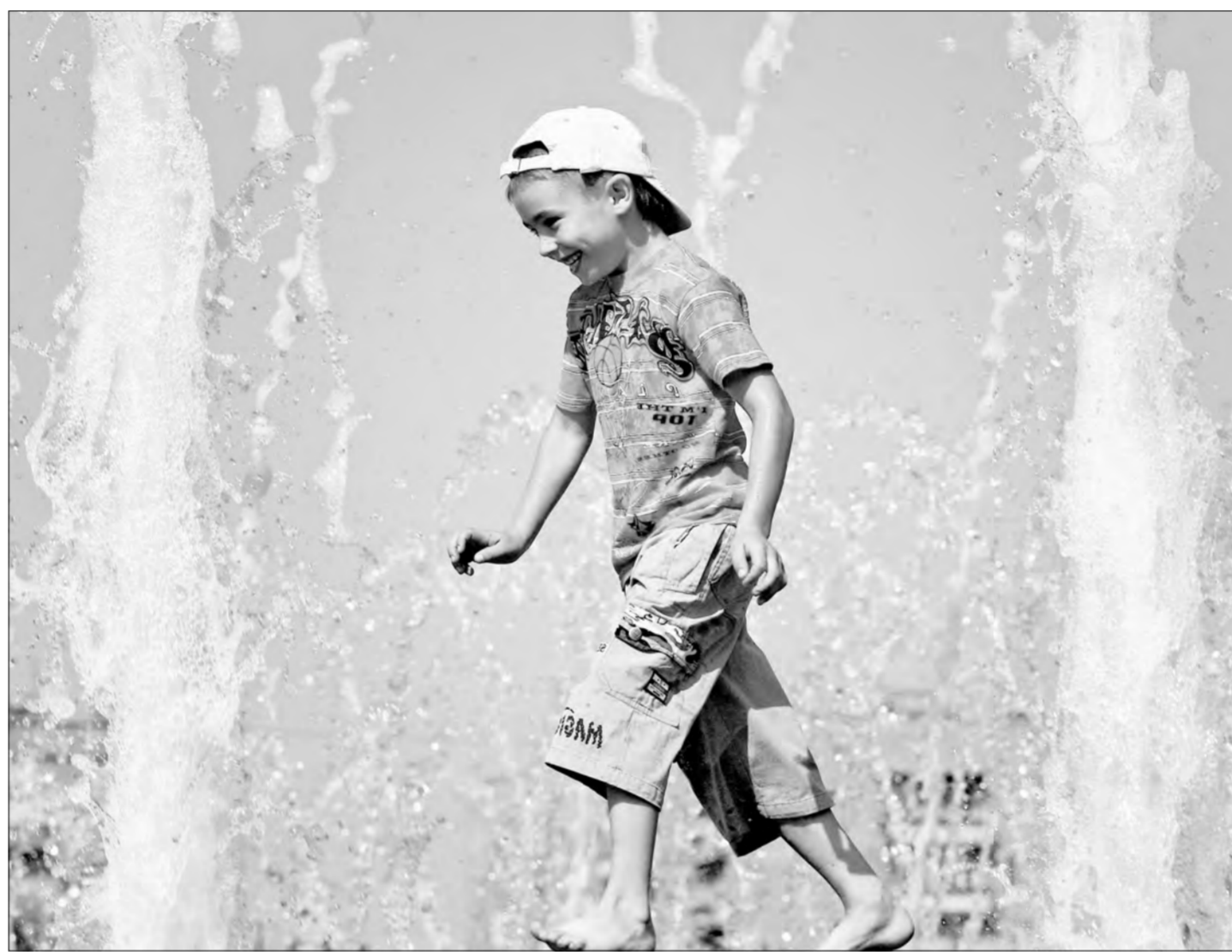
Забота о детях — одна из главных обязанностей государства. Справляется ли оно?

Председатель Госдумы Борис Грызлов накануне Международного дня защиты детей заявил, что забота о детях является одной из главных обязанностей государства. «Создание необходимых условий для того, чтобы каждому ребенку комфортно и безопасно жило в России, — приоритетная задача государства на ближайшее время и на долгосрочную перспективу», — процитировало слова спикера Управление Госдумы по связям с общественностью и взаимодействию со СМИ. При этом председатель Госдумы обратился к родителям, воспитателям и учителям, призвав их проявлять терпение и понимание, окружить детей заботой, вниманием и любовью. «Государство, со своей стороны, вам в этом, безусловно, поможет. Только так, совместными усилиями мы сможем воспитать поколение, которое нас не разочарует», — подытожил Грызлов. В это же время спикер Совета Федерации, лидер партии «Справедливая Россия» Сергей Миронов заявил, что государству не удастся решить проблемы детей. В своем интервью агентству «Интерфакс»